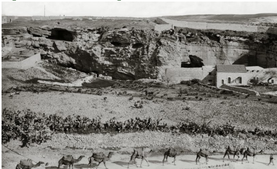
Stâncă în formă de craniu aproximativ 1900

Crucificările erau de obicei duse la îndeplinire lângă drumurile aglomerate pentru a servi ca o pildă vie pentru alți potențiali rebeli. Acesta era tocmai un astfel de loc cu drumuri principale spre Damasc și Ierihon. Biblia ne spune că L-au scos pe Isus din cetate ducându-și crucea spre locul zis al "Căpățâniilor" (Golgota în aramaică, Calvar în latină). Acolo a fost crucificat cu alți doi tâlhari, în fața unei mulțimi disprețuitoare, în timp ce trecătorii Îl huiduiau.