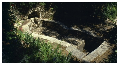
Den gamle vinpressen

Gå nå tilbake inn i hagen og sving til høyre ved skiltet «The Tomb». Lenger framme vil du se et fotografi på høyre side. Du står nå over en av Jerusalems største vannsisterner som rommer over 900 000 liter regnvann. I sin nåværende form er den datert til korsfarertiden, men en tidligere versjon av sisternen kan ha vært brukt i det første århundre. Det kan bety at hagen var en nyttehage, som f.eks. en vingård, på Jesu tid. Om du tar en kort omvei, mot butikken vår, vil du se en godt bevart vinpresse som ble utgravd i 1924. Denne oppdagelsen kan tyde på at hagen opprinnelig var en stor vingård, muligens hagen til denne rike mannen, Josef fra Arimatea.