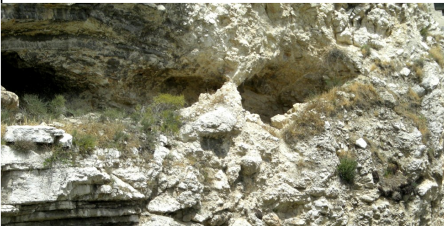
Den hodeskalleformede klippen

Det tradisjonelle stedet for denne helt spesielle hendelsen er Gravkirken, som dateres tilbake til 300-tallet, da Konstantin var keiser. I mer enn 200 år