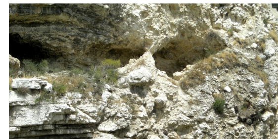
צורת גולגולת במצוק

על פי מסורת נוצרית קדומה, המקום בו התרחש אירוע זה, נורא ההוד, מסומנת כיום על ידי "כנסיית הקבר הקדוש" אשר נבנתה בין חומות ירושלים במאה הרביעית לספירה במצוות הקיסר קונסטנטינוס. החל מן המאה התשע עשרה היו צליינים וחוקרים פרוטסטנטים אשר הטילו ספק לגבי אמיתותו של