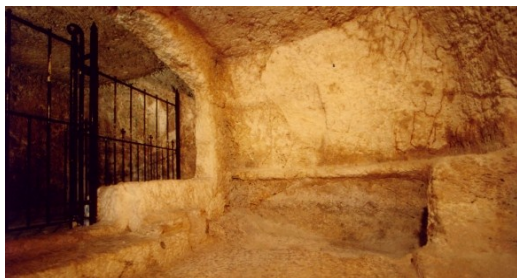
מקום קבורה חצוב בסלע

שימש כגן, וליתר דיוק כרם, בתקופת הברית החדשה, בהתאם למסופר לעיל. קרי, ייתכן וכרם זה היה בבעלותו של אותו יוסף איש רמתיים אשר בקברו הונחה גופתו של ישוע.