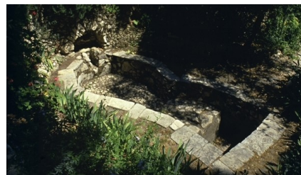
L'ancien pressoir à vin

Veuillez maintenant retourner au jardin, en tournant sur la droite à la hauteur du panneau de la tombe. En avançant vous remarquerez, sur votre droite, une photographie. Vous vous trouvez au-dessus d'une des plus grandes citernes d'eau de pluie de Jérusalem. Elle peut contenir jusqu'à un million de litres environ. Elle remonte au temps des Croisés. Une ancienne version de la citerne aurait pu être en service au premier siècle, ce qui démontrerait que le jardin était en activité, avec probablement une vigne au temps de Jésus. En réalisant un petit détour en direction du magasin, vous pourrez voir un pressoir à vin en bon état. Il fut découvert lors de fouilles en 1924. Cette découverte suppose que le Jardin était, à l'origine, un vignoble d'une taille considérable appartenant probablement à un homme riche, Joseph d'Arimathie.