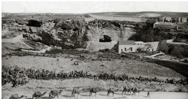
La Falaise en forme de crâne

L'emplacement traditionnel de cet extraordinaire événement est l'Eglise du Saint Sépulcre instauré au cours du IVème siècle, pendant le règne de l'Empereur Constantin.