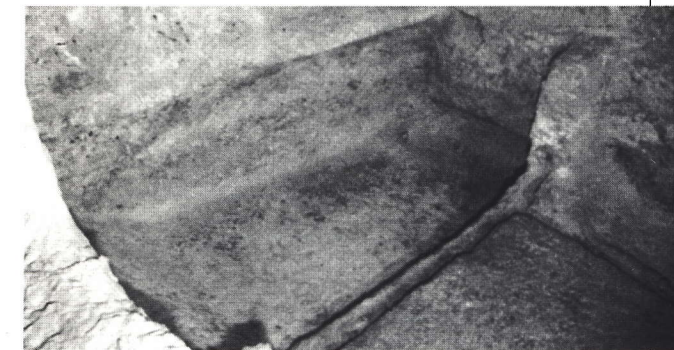
Kiveen hakattu hautapaikka

Emme tiedä, onko tämä alue Jeesuksen ristiinnaulitsemisen, hautaamisen ja ylösnousemuksen todellinen tapahtumapaikka. Puutarha kuitenkin vastaa yksityiskohtia myöten evankeliumien kuvausta ja auttaa monia näkemään mielessään ensimmäisen pääsiäisaamun ihmeelliset tapahtumat.