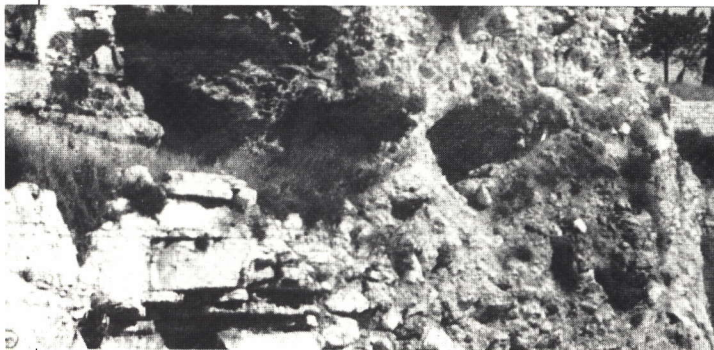
Pääkallon muotoinen kallioseinämä

Tämän perinteen luotettavuus on viimeisten 200 vuoden ajan asetettu kyseenalaiseksi. Kannan, jonka mukaan kivilouhos (nykyinen linja-autoasema) olisi voinut olla Jeesuksen muurin ulkopuolella tapahtuneen ristiinnaulitsemisen paikka, kuuluisin puolestapuhuja oli kenraali Charles Gordon.