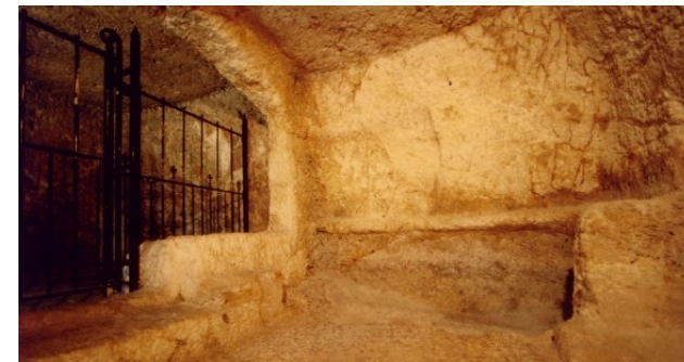
Gravpladsen, udhugget i bjerget

Fortsæt ned ad trapperne til området foran graven. Vær forsigtig, da underlaget er meget ujævnt.