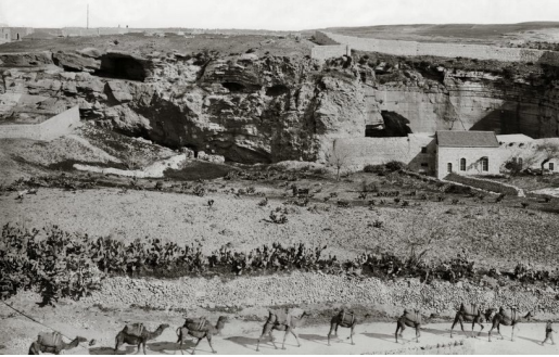
Kafatası şeklindeki sarp kayalık

Çarmıha germek genellikle işlek yolların kenarında potansiyel isyancıları caydırmak amacıyla yapılırdı. Böylesi bir yer Şam ve Eriha ana yollarının çok yakınında olabilirdi. Kutsal Kitap'ta bize İsa'nın çarmıhını taşıyarak şehirden çıkartıldığını ve "kafatası yeri" (Aramice: Golotha, Latince: Calvary) denilen yere götürüldüğü anlatılır. Orada iki hırsızla birlikte ve azgın bir kalabalığın önünde oradan geçen insanların hakaretleri arasında çarmıha gerilmiştir