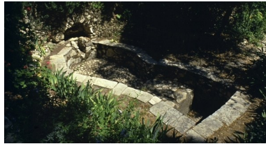
Antik üzüm cenderesi

Kutsal Kitap bize şöyle der: "İsa'nın çarmıha gerildiği yerde bir bahçe, bu bahçenin içinde de henüz hiç kimsenin konulmadığı yeni bir mezar vardı." (Yuhanna 19:41). Ölümünde sonra, Yahudi'lerin Şabat'ı başlamadan önce, İsa'nın