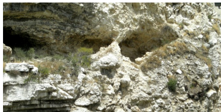
Ang Hugis Bungo na bangin

Ang kinaugaliang dako sa di-pangkaraniwang pangyayaring ito ay ang Iglesia ng Banal na Puntod na natatag noong Ika-4 na siglo, sa panahon ni Emperador Constantino. Sa loob ng 200 taon ay may ilang nag-