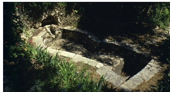
Ang Lumang Pisaan ng Ubas