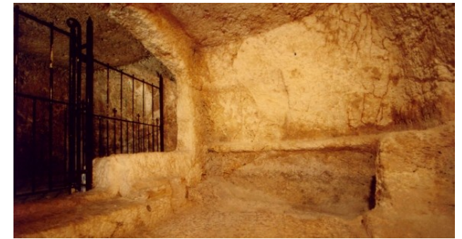
Ang Libingan sa Inukit na Bato

Habang tumatahak pababa sa sahig na bato sa harap ng puntod, masasaksihan mo ang pinakaabangang bahagi ng iyong pagbisita sa hardin.