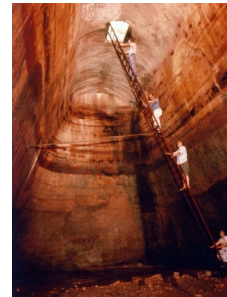
Ang Balon para sa Tubig Ulan

Ang pagkatuklas sa pisaan ng ubas na ito ay nagmumungkahi na mayroong ubasan, maaaring ito ay hardin ng nakaririwasa sa buhay na si Jose ng Arimatea.