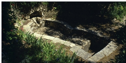
Το αρχαίο πιεστήριο σταφυλιών

Τώρα σας παρακαλώ να επιστρέψετε στον κήπο, στρίβοντας δεξιά στην πινακίδα που δείχνει τον τάφο. Πιο πέρα, θα προσέξετε στα δεξιά, μια έγχρωμη φωτογραφία σ' ένα δένδρο. Στέκεστε πάνω από την τρίτη πιο μεγάλη δεξαμενή για βρόχινο νερό χωρητικότητας πάνω από 200,000 γαλλόνια (περίπου ένα εκατ. λίτρα). Έχει επιβεβαιωθεί ότι ανήκει σε προχριστιανική περίοδο, πράγμα που σημαίνει ότι ήταν ένας κήπος εν λειτουργία, όπως ένας ελαιώνας, ή περιβόλι με οπωροφόρα δένδρα ή ένα αμπέλι στην εποχή του Ιησού. Με μία μικρή παράκαμψη προς το κατάστημά μας θα βρεθείτε σ' ένα καλοδιατηρημένο πιεστήριο σταφυλιών. Ήρθε στην επιφάνεια με τις ανασκαφές του 1924 και είναι ένα από τα μεγαλύτερα που ευρέθησαν στο Ισραήλ. Η ανακάλυψη του δείχνει ότι ο