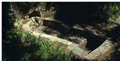
Die antieke wynpers

Stap nou terug vanaf die platform by "Skull Hill", draai regs by die teken wat die rigting van die graf aandui. 'n Entjie verder sal jy 'n foto van 'n ondergrondse reënwatertenk sien. Jy staan nou bokant een van Jerusalem se grootste ondergrondse reënwatertens (cistern), wat meer as 200,000 UK gellings (900,000 liters) bevat. Daar word geglo dat dit dateer uit 'n vorige Christelike tydperk en dat die water daarvan gebruik was om wingerde in 'n landboutuin te besproei. Aan die onderkant van die sistern net voor die winkel sal u 'n goedbewaarde outentieke wynpers sien. Dit is opgegrawe in 1924 en is een van die grootstes wat nog in Israel gevind